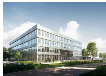
P8 - Tilburg