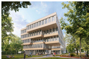
R10 - Eindhoven